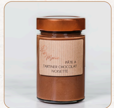
Pâte à tartiner : Pâte à tartiner chocolat et noisette 9,60 € TTC