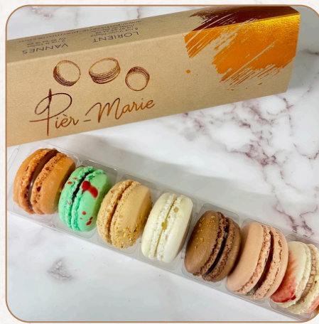
Coffret de Macarons assortis : Du craquant et du fondant dans un même coffret 8 pièces : 14,80 € TTC 16 pièces : 29,60 € TTC 24 pièces : 43,40 € TTC