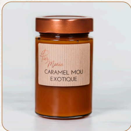
Caramels Caramel au beurre salé 8,20 € TTC Caramel aux fruits exotiques 9,20 € TTC