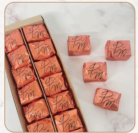
Marrons glacés de Turin : Marrons confits et glacés au sucre, la référence la pièce : 3,90 € TTC coffret 7 pièces : 27,30 € TTC coffret 14 pièces : 49,50 € TTC