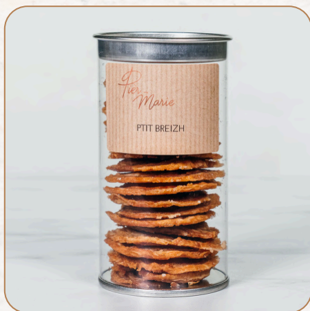
P'tit Breizh : Nos fameuses chips bretonnes caramélisées 8,40 € TTC