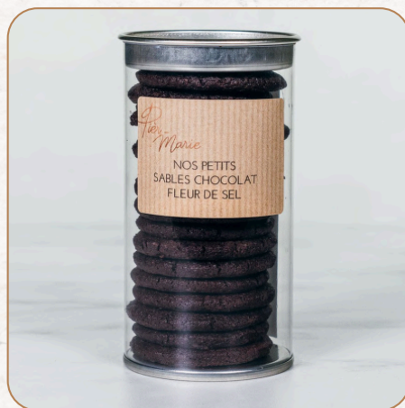
Sablés chocolat fleur de sel Un petit sablé tout chocolat et pointe de fleur de sel qui ravira les plus gourmands 9,10 € TTC