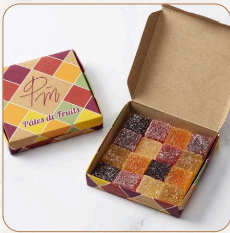
Pâtes de Fruits : Assortiment de pâtes de fruits aux saveurs intenses 11,50 € TTC