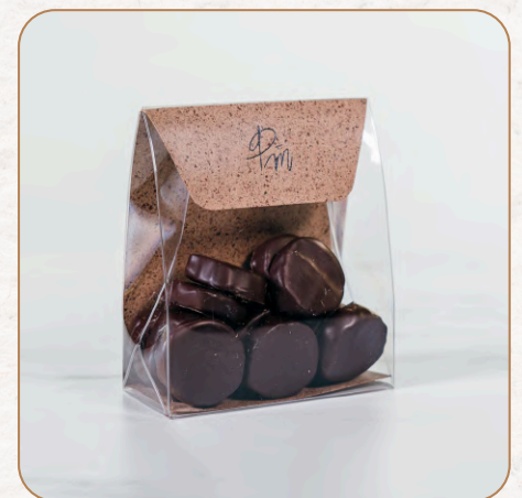
Fruits confits : Écorces d'oranges ou écorces de citrons ou pétales de gingembre confits enrobés de chocolat noir 16,50 € TTC